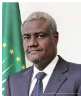
S.E. Moussa Faki Mahamat Président de la Commission de l'union africaine